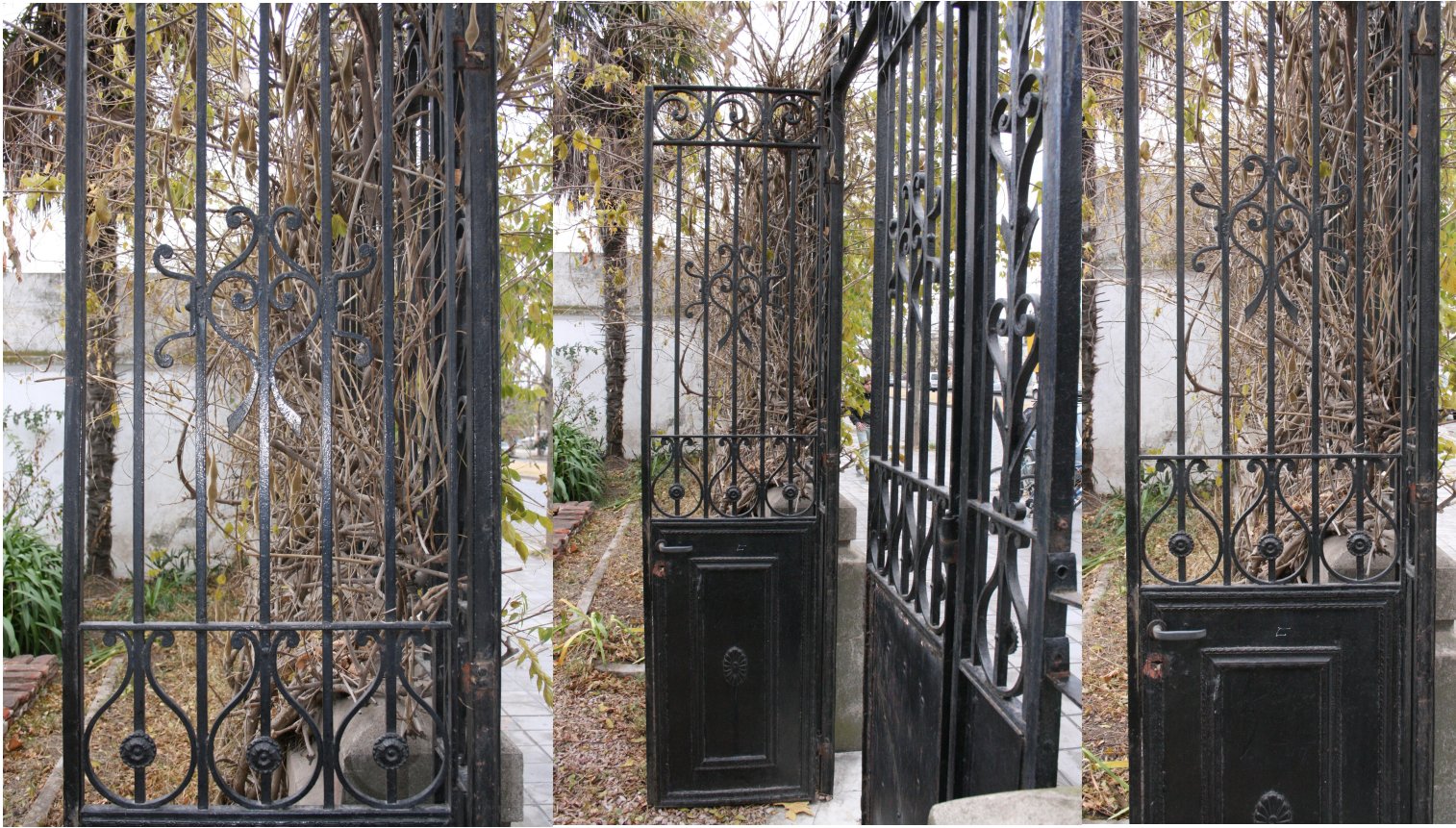
Detalles de la verja de entrada que se puebla de glicinas (tal vez la casa debió llamarse por este motivo el chalet de las glicinas)