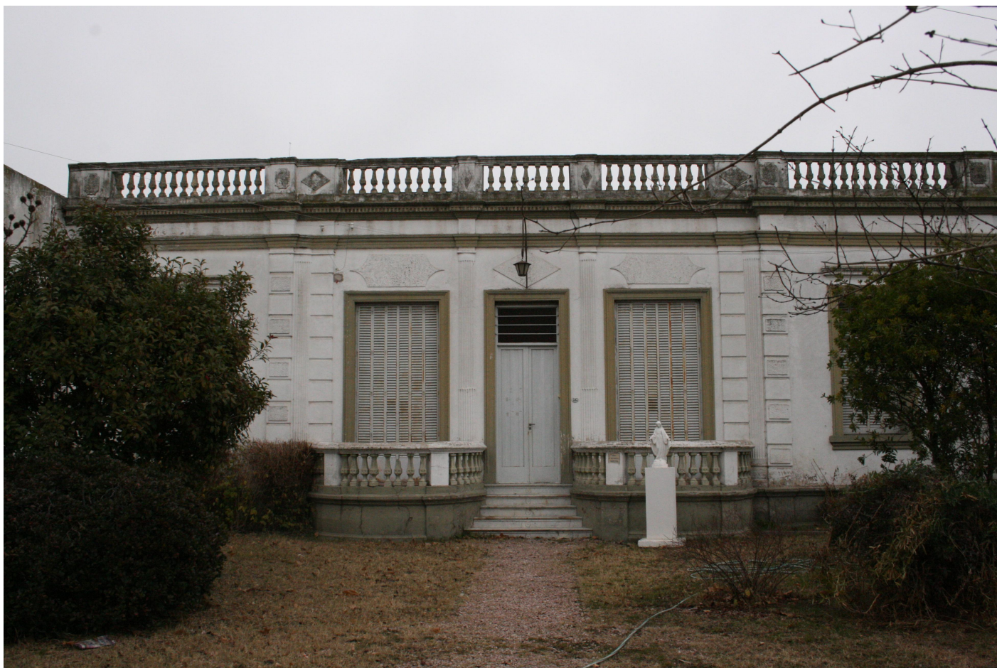
Vista de la fachada