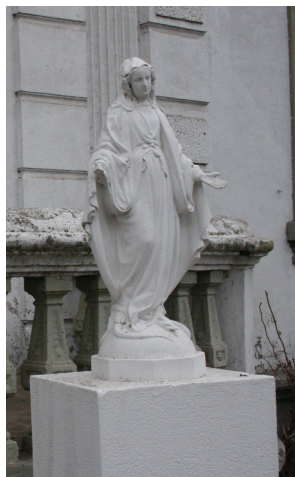
María, corredentora del género humano