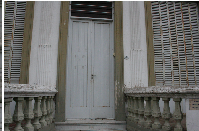
El detalle de la escalera es el mismo que en el Palacio Municipal