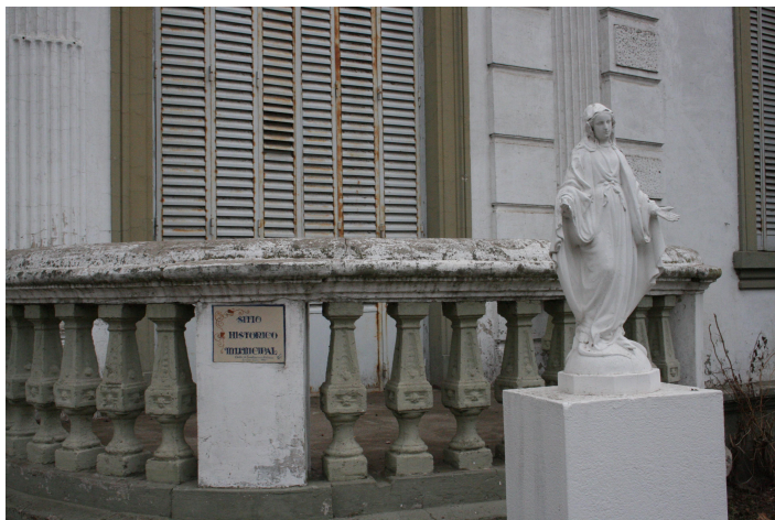
Detalles de la fachada